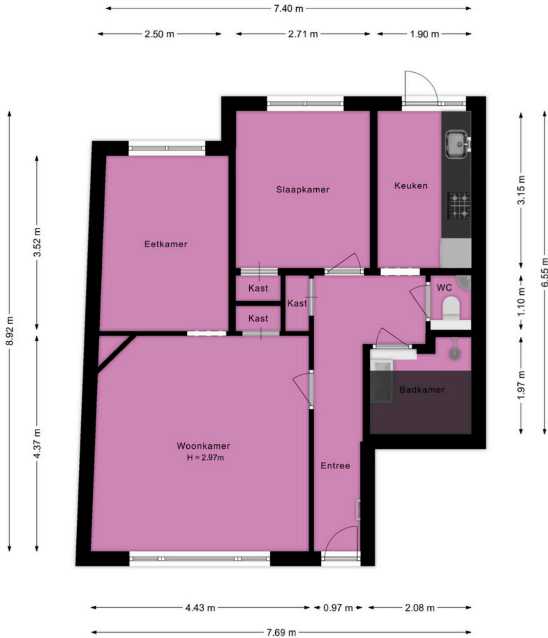
Utrechtsche Jaagpad 10F Leiden Begane grond